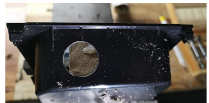
Hole in one