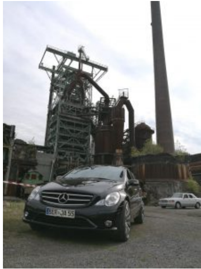
Schöne Sterne 2016